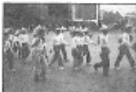
五歲利治民一苦行隊伍的小將