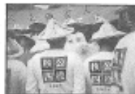
一場精誠，可謂表裏共赴再大的「共難」，也會被實踐的「共難」轉去不少——願力多大，業力的消解也就有多大