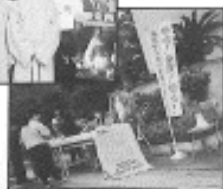
動物園內萬人簽名支持二拒