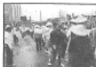
歡歡喜喜發陣行 六百餘人的苦行隊伍 從一般與上流，橫跨有公堂，隨時有民衆自願加入精進