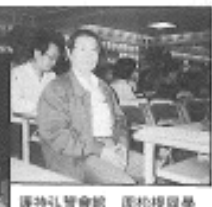
護持弘誓會館 同松根同學