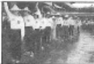
舉行集會準備上路

除了到處有「毒」外，「以鄰為壑」也是罕見的心態。隊伍行經奇雅區時，有一位候選人的總部佈置得很「熱鬧」，但四週馬路上滿佈鞭炮屑、塑膠的、紙的都有。或許是成立儀式上用的。為什麼不自己掃掃乾淨呢？我相信那些花園以內的範圍不會是這個樣子。範圍以外的，留給清