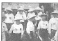
可敬的志工們！ 陪林義雄先生一起環島苦行，走足千里