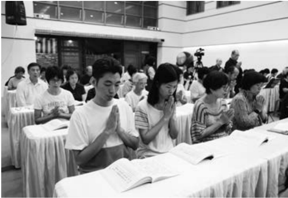
▲ 信眾在莊嚴肅穆的氛圍裡，更升起追思與虔敬之心。(108.8.24)

佛」，我們也許沒有辦法如此偉大，但我們不能疏忽自己能做甚麼，要以菩薩為目標、為榜樣趨向於這條路。要克服我們對自己的舒適要求，我們的眼耳鼻舌身意喜歡追求舒適，這是根深蒂固的，就像有的人可能為了自身的舒適而動手調整空調的溫度；有的人身上容易發出汗臭味令身邊的人退避三舍，藉此去設想地藏菩薩多偉大，一點空氣冷熱變化都令我們難以忍受，一點酸臭的味道就令我們覺得噁心，可是菩薩卻是這樣水裡來火裡去，所以要做菩薩的小跟班還要跟得起才行，要能心心念念著如何為他人提供舒適的環境，而不是如何排除萬難為自己提供舒適的環境。假設我們的心能趨向於此，我們就跟得起地藏菩薩。如果老是在想著自己舒