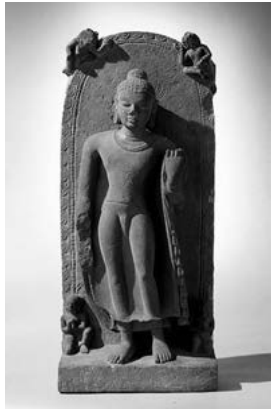
▲世紀末笈多王朝立佛造像。