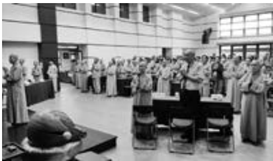
上午，於無諍講堂舉行開學典禮，迎接新學年的開始。