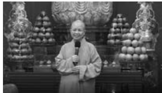
下午，《地藏經》誦畢，大眾聆聽昭慧法師開示。