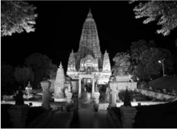
◀ 佛陀成道處菩提迦耶。