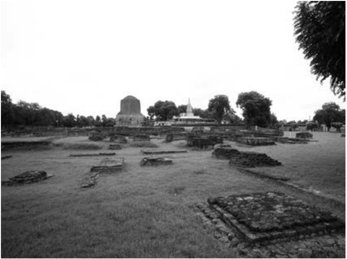
▲鹿野苑是佛陀初轉法輪為五比丘說法的地點。

夜是二點到六點。佛陀在後夜時分，用天眼看「見諸大天神各封宅地，中神、下神亦封宅地」，這空間滿滿的都是善神，而且他們各自分封宅地。這是雙重的宇宙觀，人間的凡夫看不到諸神，可是佛陀用天眼看到諸神在巴陵弗城分封宅地。