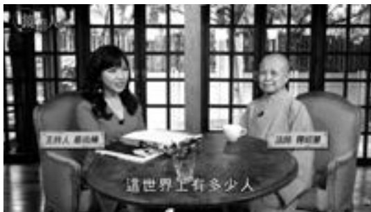
網路【鏡電視】的《鏡相人間》專欄，本日播出昭慧法師的專訪。

原來，本年5月21日，昭慧法師受《鏡週刊》記者曾芷筠女士之邀，至台北市中正區公益圖書館「文房」，錄製蔡尚樺女士主持的電視訪談節目。本節目在東森及MOD靖天電視台播出，時間半小時。