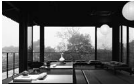
汐止「食養山房」，具有茶禪一味與自然相生的人文之美。