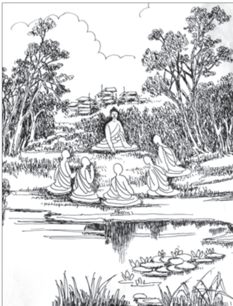
◀ 佛陀說法圖，蘇敬生先生繪畫。