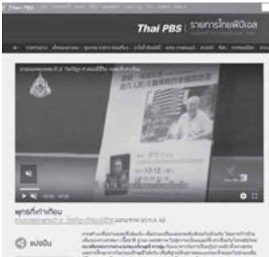
泰國公視PBS報導〈追尋佛陀足跡 ตามรอยพระพุทธเจ้า——美好的歷史會遇〉專題紀錄片。