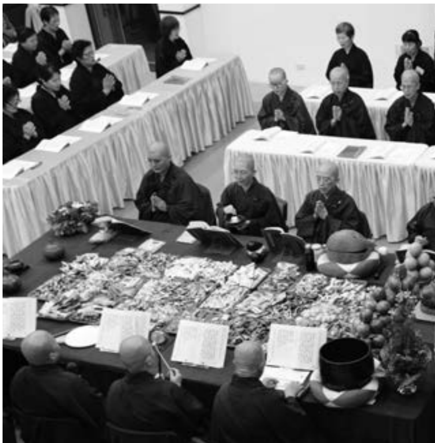
▲ 本院於8月24日舉行一年一度地藏法會，由昭慧法師主法。 (108.8.24)

各位法師、各位居士： 今天是個好日子，昨天我們住眾和布置會場的志工都在傷腦筋，萬一颱風來了該怎麼辦？壇場內有這麼多蓮位，整個的設計不足以抵擋強烈的颱風，很不得已的情況下想了一個方案，若颱風來襲，如果連帳棚都沒辦法使用，那就要在齋堂牆邊立起蓮位，普渡的物資也都要放到裡面來。雖然氣象報告顯示颱風偏南，但還是擔心會出現誤差，畢竟颱風總是說轉頭就轉頭；然而最後我們還是決定一切如常，幸好今日非常殊勝，今年的地藏法會成為歷年來最舒服的一次，沒有太熱，又不至於下雨，感覺相當不錯。