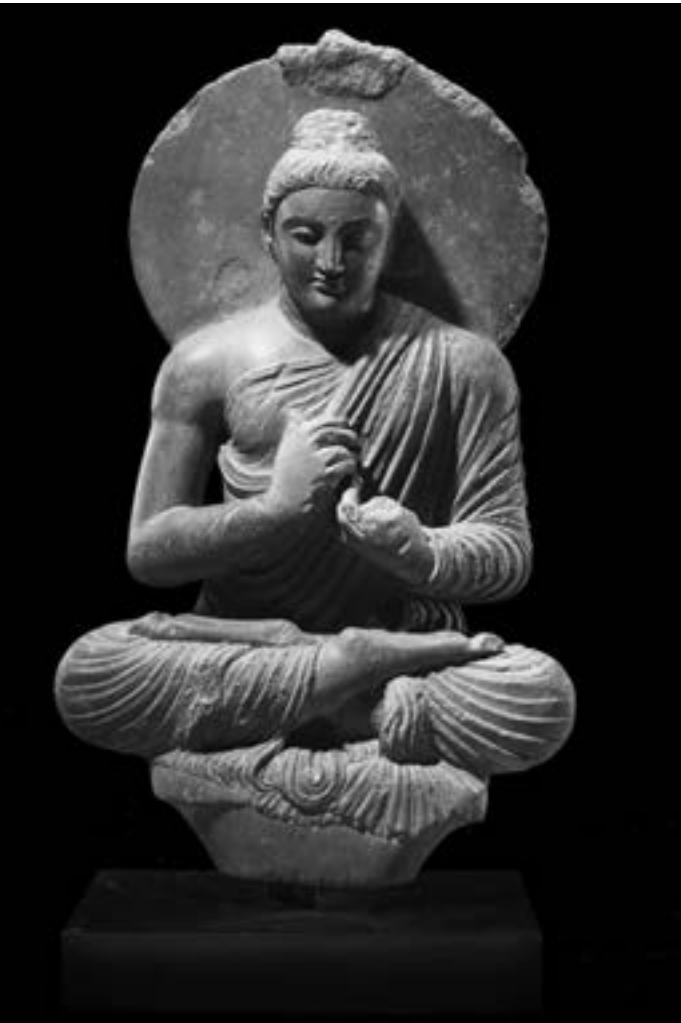
▲3-4世紀時「犍陀羅」式的佛陀說法造像。