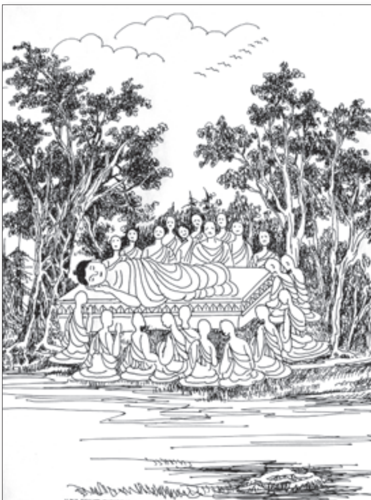
► 佛陀涅槃圖，蘇敬生先生繪畫。

佛陀讚嘆菴婆婆梨女，你的大佈施一定可以令你到達善處。種種的佈施，還有持戒，都可以讓人將來能夠到達善處，因為佈施、持戒本身就功德無限。