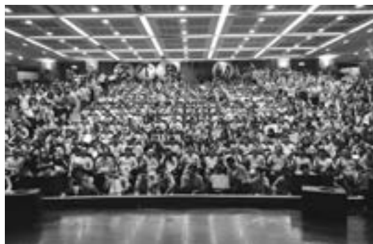
玄奘大學舉行三天新生紮根活動，本日於慈雲廳舉行開幕式。