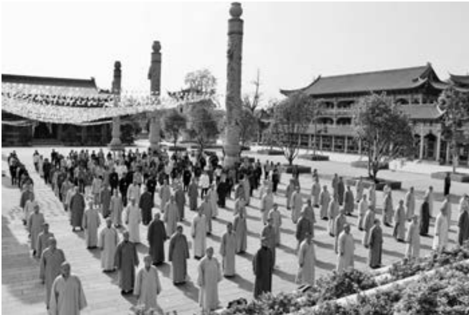
▲禪修營平均有335人參加，其中出家眾150人。大眾集合在廣場上做柔胯鬆肩，好不壯觀。（107.4.7）