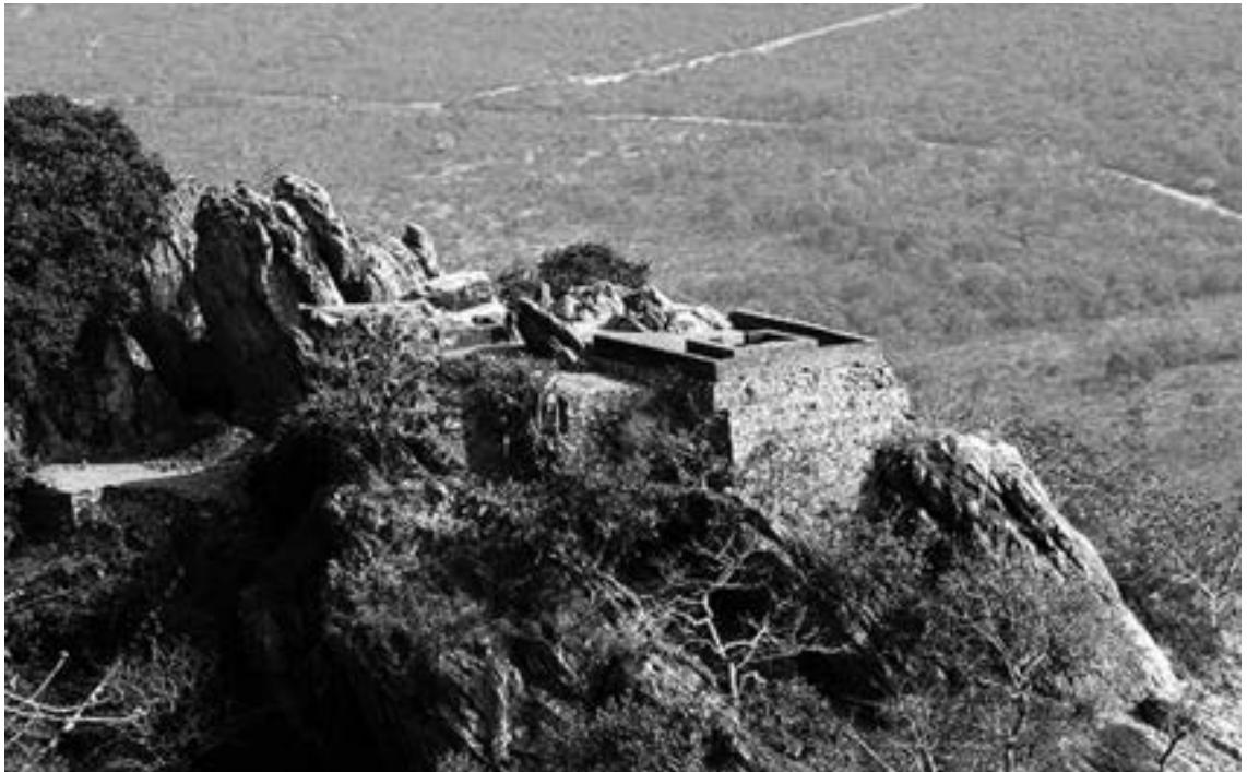
▲佛陀於王舍城靈鷲山·耆闍崛山·心經·妙法蓮華經說法台。