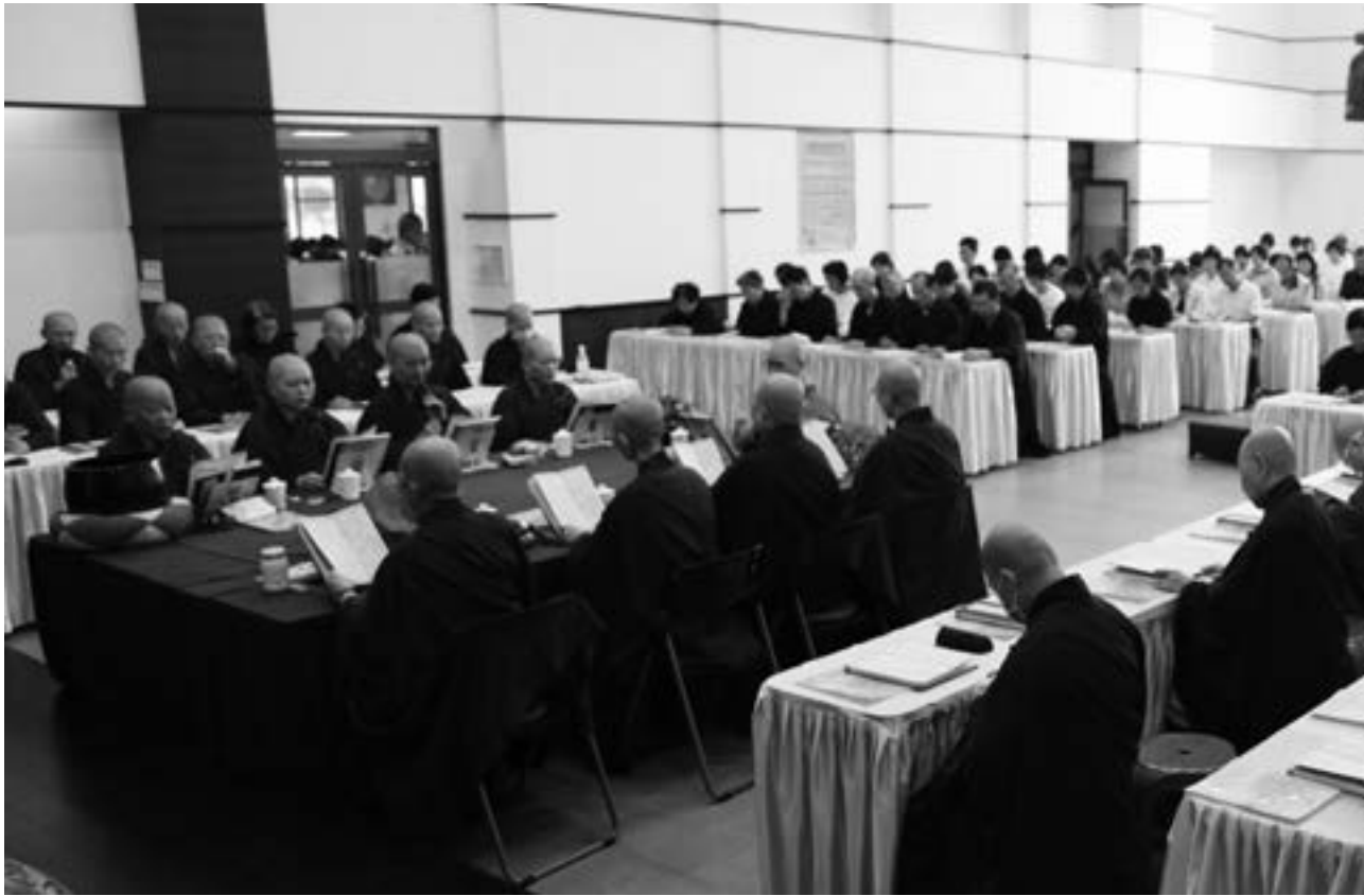
▲地藏法會虔誠誦經文的緇素二眾。(108.8.24)

故親人不希望看到的場面，他們期待看見我們快樂，期待我們生命充滿希望，不要憂憂戚戚。哀傷不但解決不了問題，也拖垮自己的情緒跟身體，然而思念亡故親人是一種很正常的感情，要如何運用這份情感，對自己和亡故親人都做出正向的意義，最好的方式就在《地藏經》裡面。大家今天從早上唸到下午，複習了一遍，在這裡告訴我們業力果報的原理，讓我們知道六道之中最苦的眾生就是地獄眾生，但是即便到了那個被禁錮、苦到極點，無時無刻不在痛苦狀態的地方，我們都還有希望。《地藏經》的重點不在於