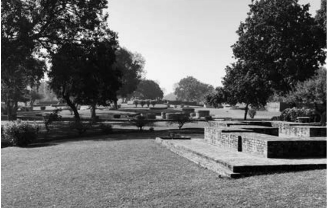
▲舍衛國祇樹給孤獨園，佛陀說法教化弟子的聖地。