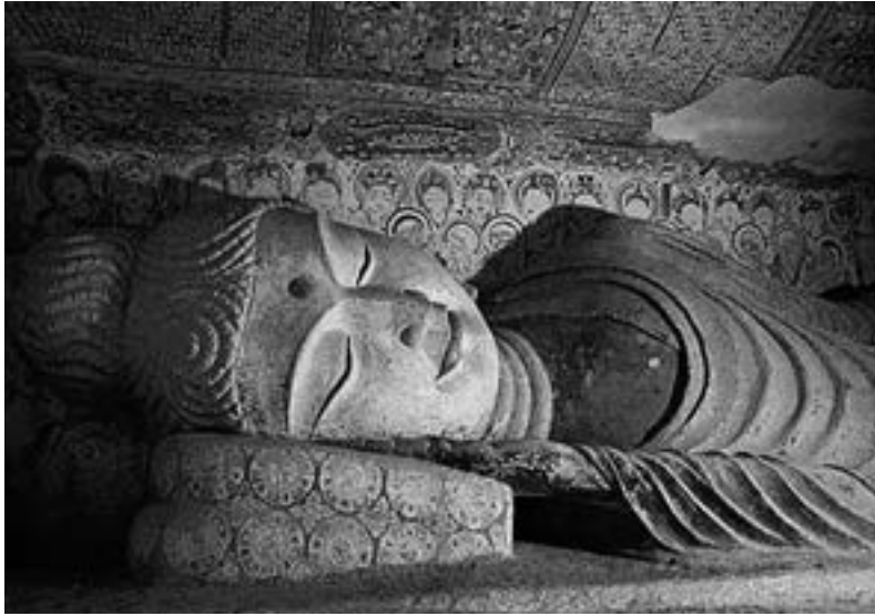
◀ 敦煌莫高窟涅槃佛像。

安居。所以然者？恐有短乏。」佛陀命弟子各自四散，去毘舍離和越祇國的其他地方，若留下來恐怕會缺少糧食。佛陀遣走弟子，自己卻和阿難留下，他並沒有告訴大家，此時「佛身疾生，舉體皆痛」，全身都疼痛，無法離開。佛陀在心中暗想：「我今疾生，舉身痛甚，而諸弟子悉皆不在，若取涅槃，則非我宜，今當精勤自力以留壽命。」現在涅槃並不妥當，因為弟子們都不在，除去剛才遣走的比丘們，另有很大的一群在各處散居。他總是希望為所有弟子們做最後教誡，而不是只有隨身的部分弟子見佛涅槃，所以才「精勤自立以留壽命」。