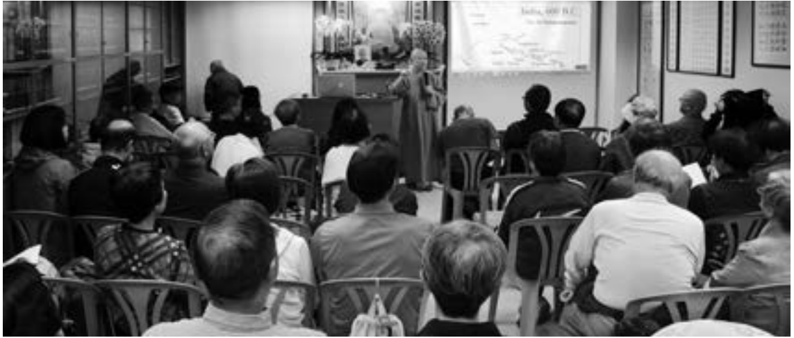
▲ 昭慧法師演講生動，大眾感受法喜充滿。(107.12.2)