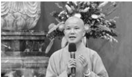
院長圓貌法師致詞，以「正見增上」期勉學生。