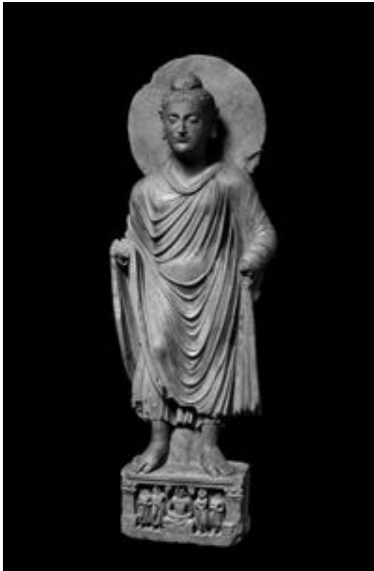
▲世紀健陀羅式立佛造像。

忖度別人的痛苦煩惱，積極地讓對方離苦得樂，把別人的痛苦當作自己的痛苦一般，用這種廣大的思路去覺知別人的痛苦，祝福別人，幫助別人離苦得樂。因此而嚴守戒法，不敢侵犯別人，怕別人因為自己行為不端而受害，用這樣的心才會通於聖路。為何這種心態的持戒才會通聖路？因為自通之法把個人與別人的藩籬打通，純然為他人設想，在這個當下忘記自己，只想對方的需求，體貼對方，用非常溫柔的心，不忍對方受傷害，