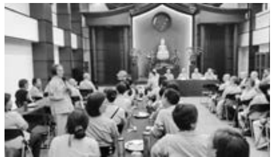
同學們於新生座談茶會中分享彼此的生命故事。