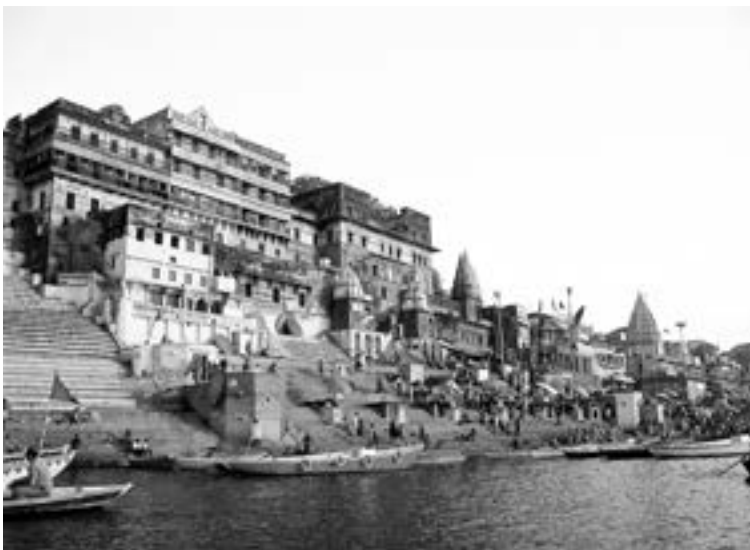
◀ 印度河流域的瓦拉納西是印度著名的宗教聖地。