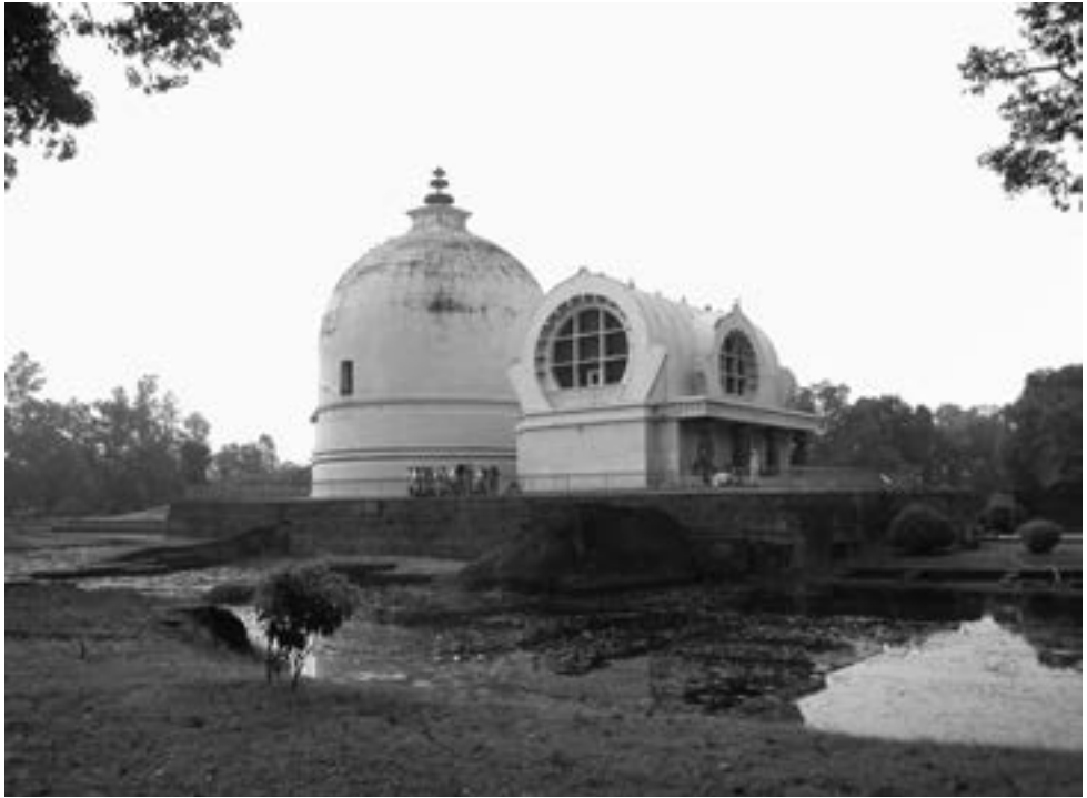
▲本院師生至印度行旅，參訪大涅槃寺（右）與阿難尊者紀念塔（左）。（92.10.10檔案照片）