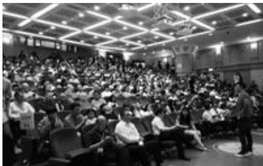
玄奘大學報到註冊日，在慈雲廳舉行的學生暨家長「與校長有約」活動。