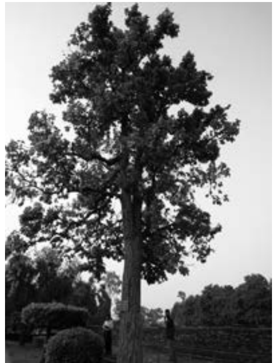
▲ 大涅槃寺前的娑羅樹幹中段開叉分枝，冥合佛陀涅槃於娑羅雙樹的意境。原樹已毀，此樹由前田行貴教授種植，樹齡約四十年。（92.10.10檔案照片）

到了遮婆羅城，佛陀背痛，於是對阿難說：「諸有修四神足，多修習行，常念不忘，在意所欲，可得不死一劫有餘。」修四神足的人可以就自己的意欲達到不死，最高