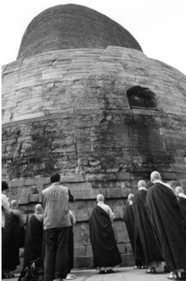
◀ 本院師生至希拉那瓦提河畔天冠寺遺跡的佛茶毘塔（Ramabal Stupa）參觀。（92.10.10檔案照片）