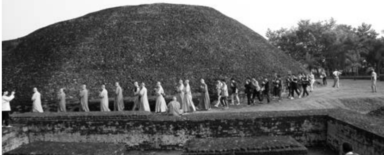
▼ 本院師生至印度行旅，大眾繞 Ramabhar Stupa 佛塔三匝。（92.10.10檔案照片）